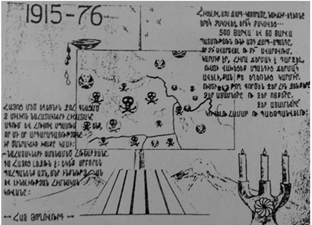
Նկ. 3. Ընդհատակյա կազմակերպության 1976 թ. ապրիլ-քսանչորսյան ֆոտոթռուցիկը: